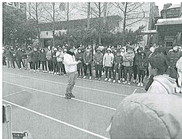
圖二 擲部動作分析及間歇訓練