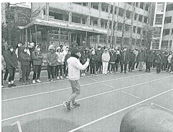
圖一 短距離訓練法