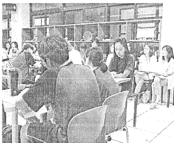
學生分組上課，每組皆有一位分組觀課老師。