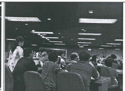
出席學校踴躍發言，並提出計畫撰寫問題。