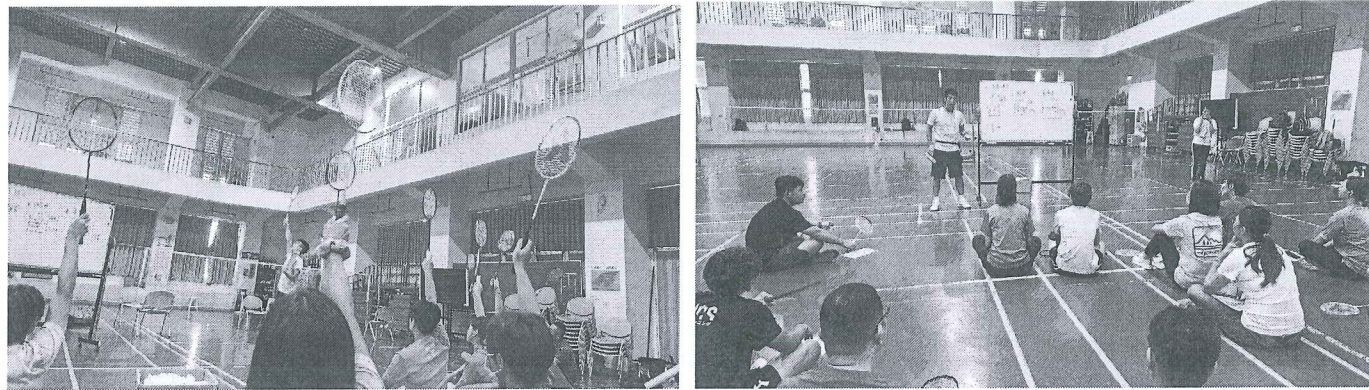
圖一 網牆性球類運動-羽球