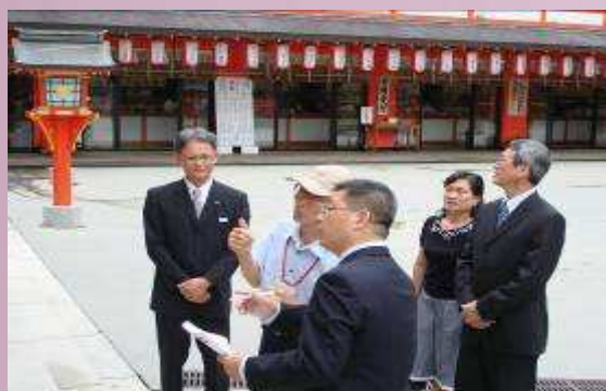
日本津和野高校傳統文化介紹