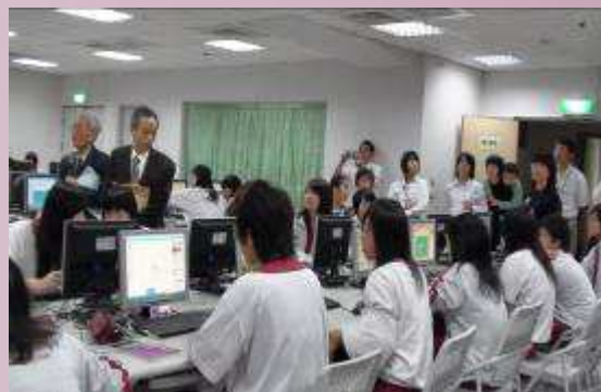
日本津和野高校參觀教學活動