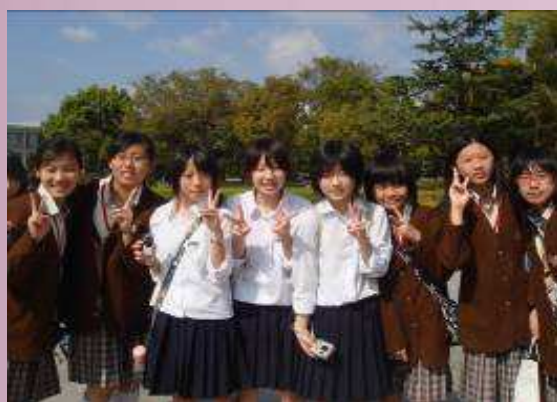
國中部分同學與日本學生交流合照