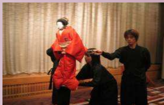
日本傳統劇--人形偶表演