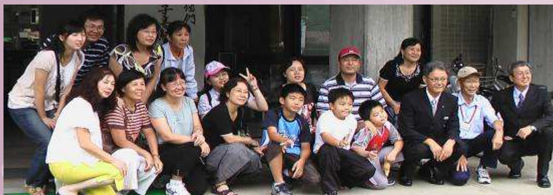
民國 97 年本校到日本交流參訪之教職員合影