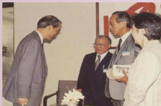
韓董事長與植草校長