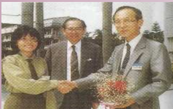
本校學生代表向植草校長獻花