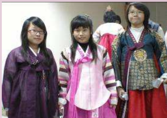
本校學生穿韓國服飾體驗韓國文化