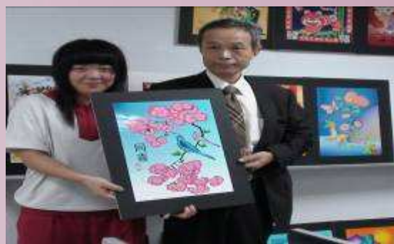
日本津和野高校校長與學生交流