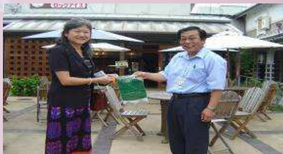
飯田市熱烈歡迎本校師生