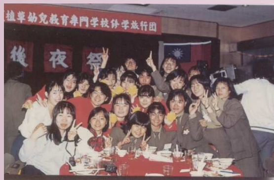
兩校學生晚會在台南大飯店合影