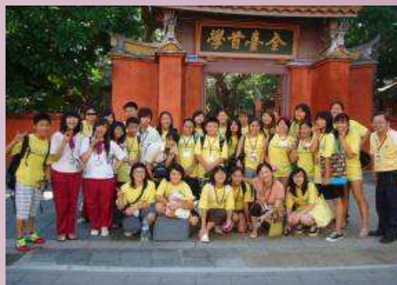
地球村學員參訪孔廟.台南文化體驗