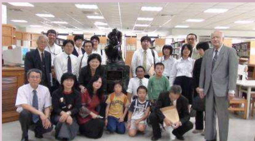
民國 97 年日本津和野高校蒞校交流