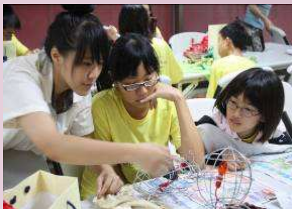
地球村學員小花燈創作