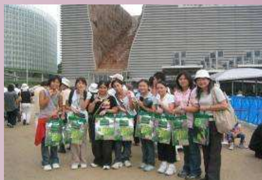
2005 愛地球萬國博覽會