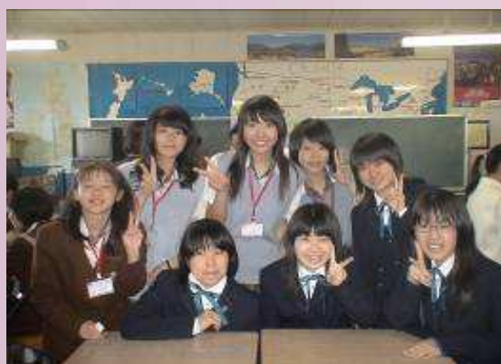
本校同學與廣島女學院學生互動