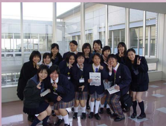
雙方學生互動交流