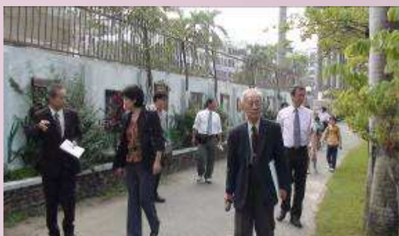
日本津和野高校參觀本校校園