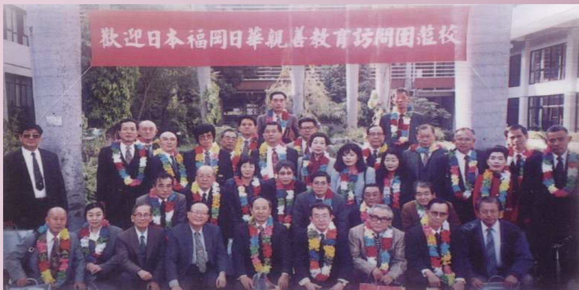
葉校長與福岡日華親善人權教育訪問團留影