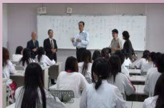
日本津和野高校參觀教學活動