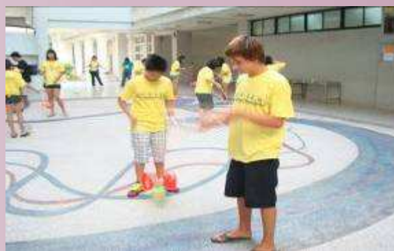
地球村學員學扯鈴.體驗台灣民俗技藝