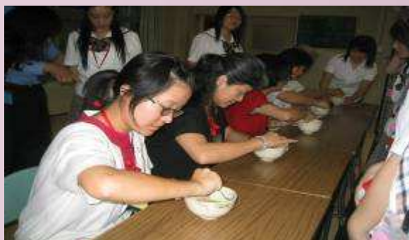
日本課程體驗--學習泡日本茶