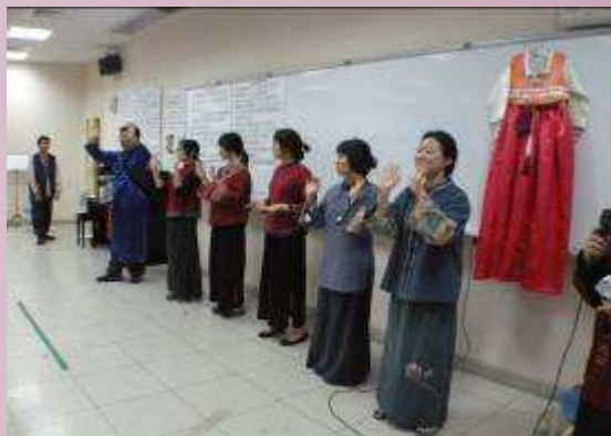
韓國學生穿本國服飾體驗本國文化