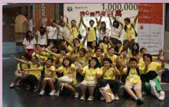
地球村學員參訪臺灣文學館