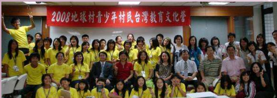
2008 地球村營隊開訓典禮.郭校長與長官貴賓及來自美國的華裔學員合影