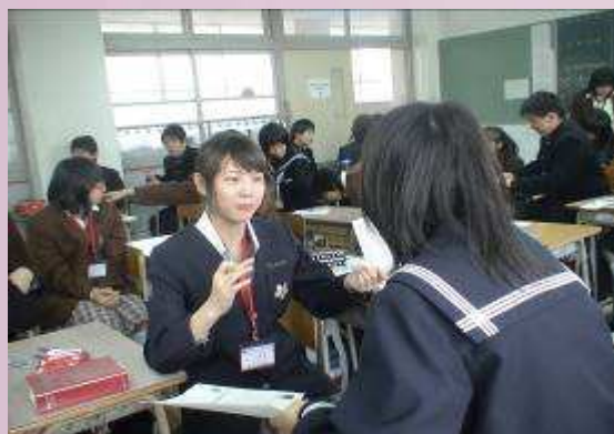
本校同學與津和野高校學生互動交流