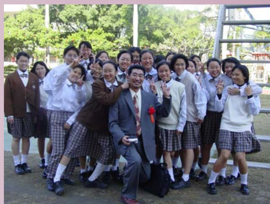
福岡日華親善人權教育訪問團與本校國中部學生文化交流留影