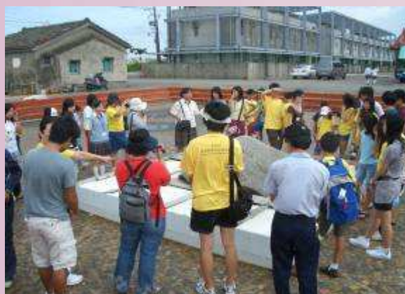
地球村學員參訪七股鹽田