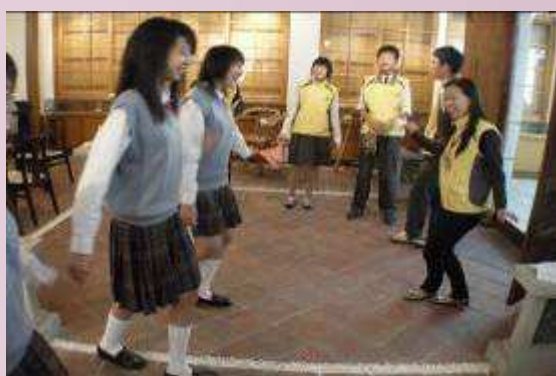
韓國學生與本校學生互動