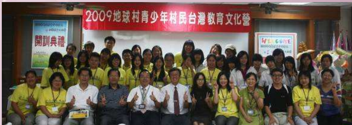
2009 地球村營隊開訓典禮.官校長與長官貴賓及來自美國的華裔學員合影