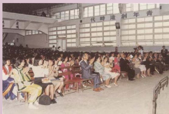
日本植草幼兒專門學校與本校文化交流