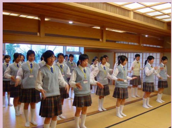
本校學生表演活動