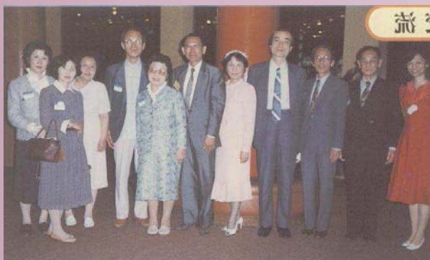
晚會後兩校代表在台南大飯店合影