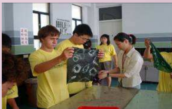
地球村學員手工印染實作