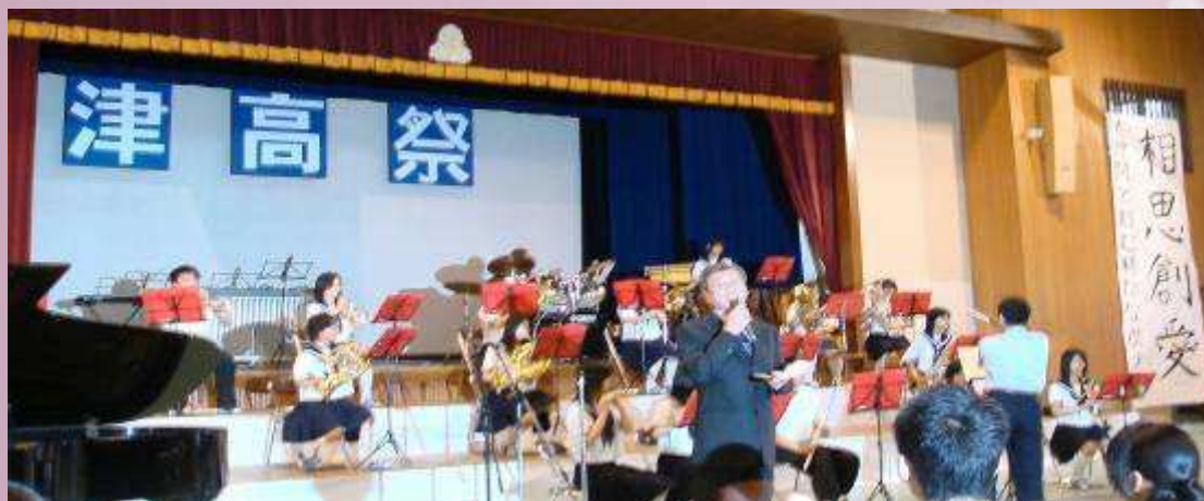
官校長帶領本校教職員參加日本津和野高校創校一百週年校慶交流活動