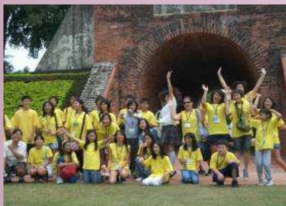
地球村學員參訪億載金城