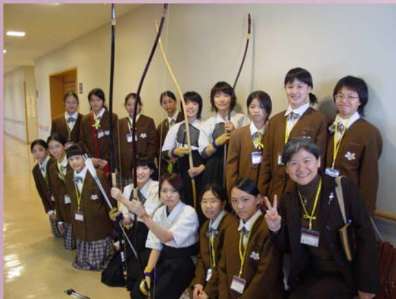
東京都立晴海總合高校與本校學生合照