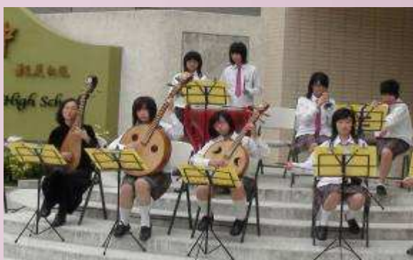
本校學生表演節目歡迎津和野高校