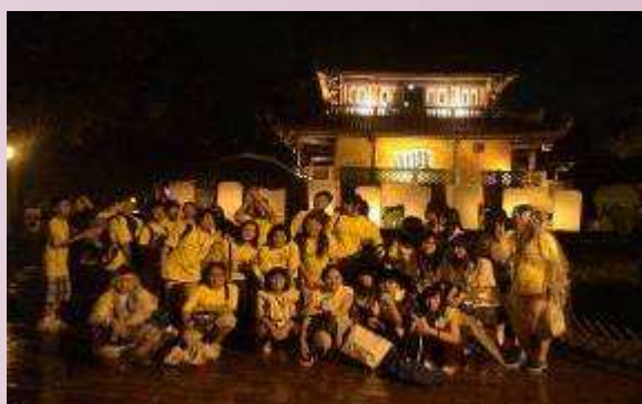
地球村學員參訪赤崁樓.體驗府城文化