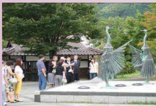
日本津和野高校傳統民俗介紹