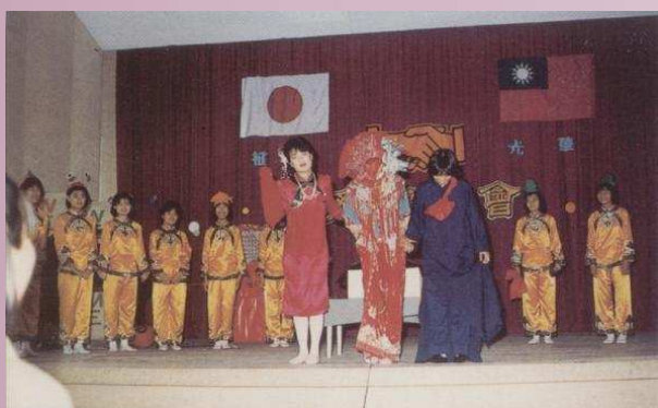
歡迎會--本校學生表演節目