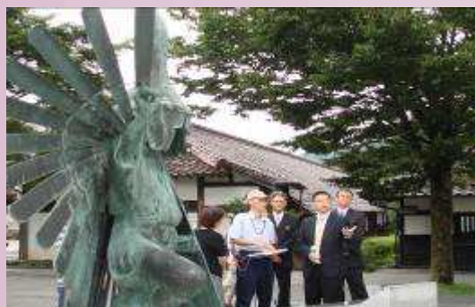
日本津和野高校傳統民俗解說