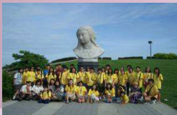
地球村學員參訪林默娘公園.體驗府城文化