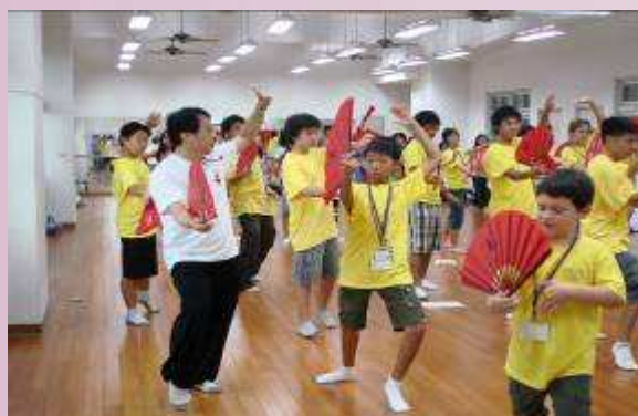
地球村學員學習太極扇