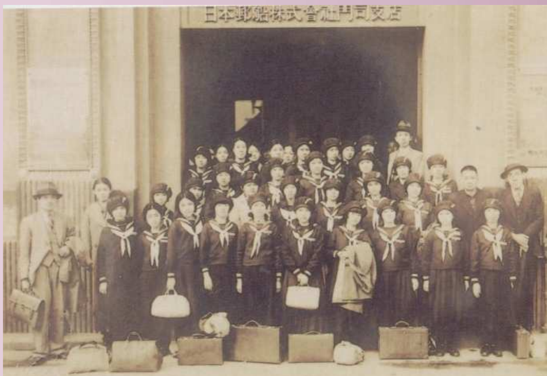
光復前（和敬女學校時代） 老師帶領學生到日本畢業旅行.增廣見聞及文化體驗