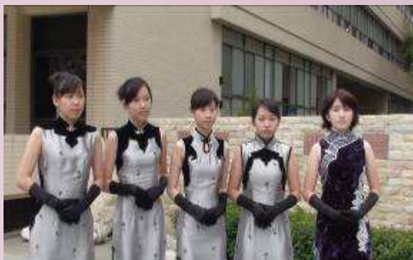
本校服裝科學生列隊歡迎津和野高校