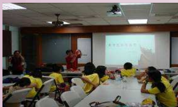
地球村學員東方色彩學上課實況