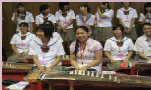
飯田女高學生彈奏日本邦樂