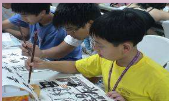
地球村學員書法國畫練習