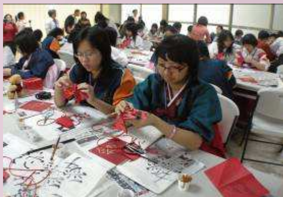
本校師生教韓國學生剪紙藝術