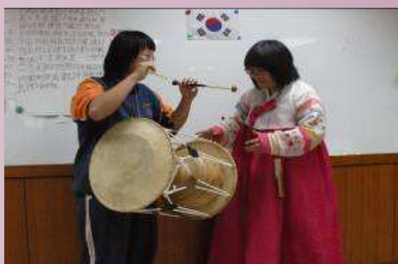
韓國學生教本校學生打韓國傳統鼓