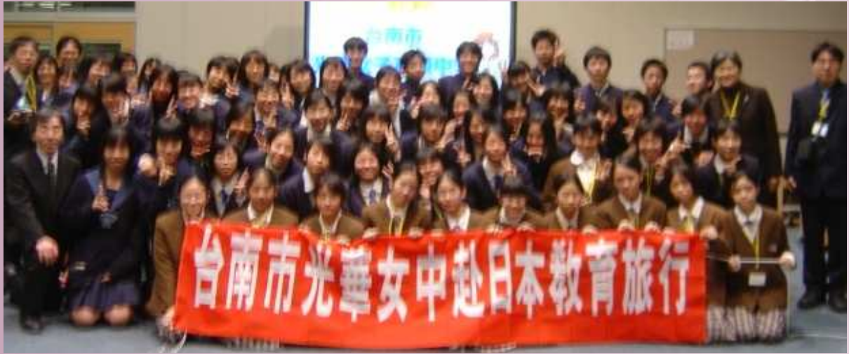
2004年日本教育旅行郭校長與全體師生合影