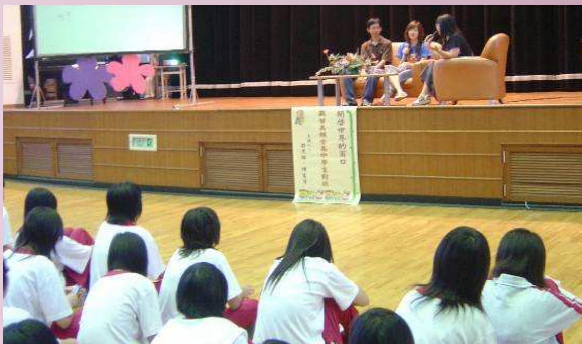
本校綜合高中學生與留美綜高學生對談,藉由互動以了解雙方文化異同