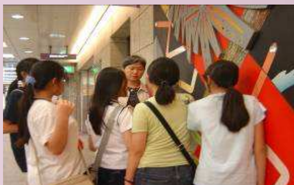
校長比較大阪市和台南市的情形