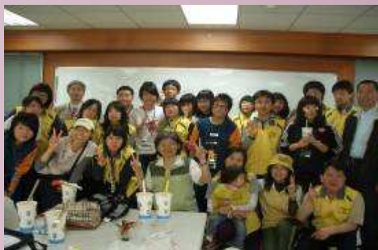
郭校長及同學與韓國師生合影