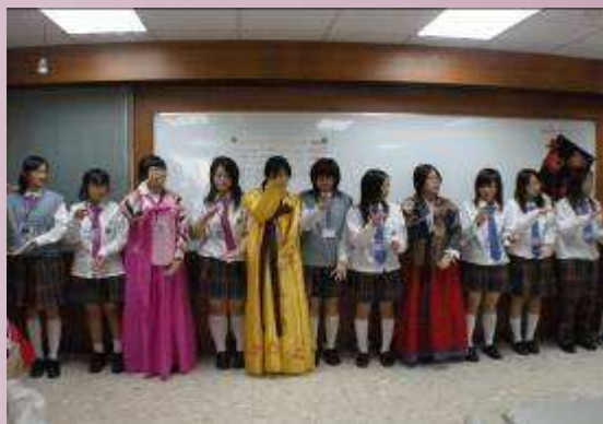
韓國學生與本校學生互動交流