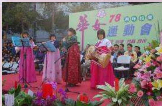
韓國師生參加本校運動會樂器表演