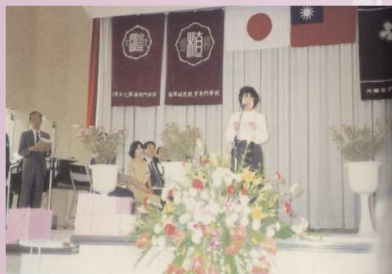
日本學生代表上台致詞