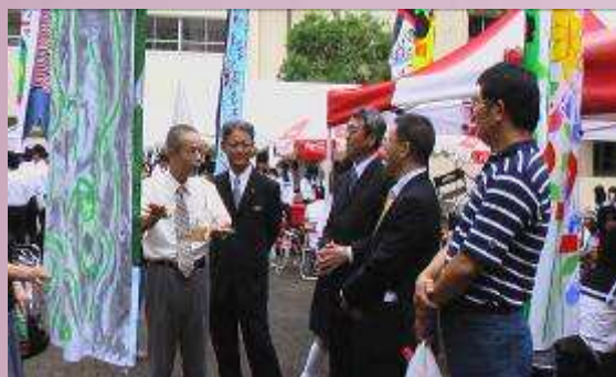
日本津和野高校傳統民俗解說