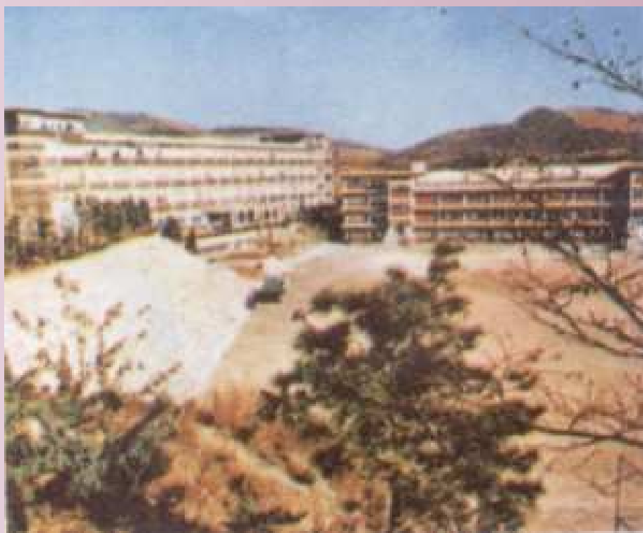
韓國漢城松谷女子高級學校(姊妹學校)校景