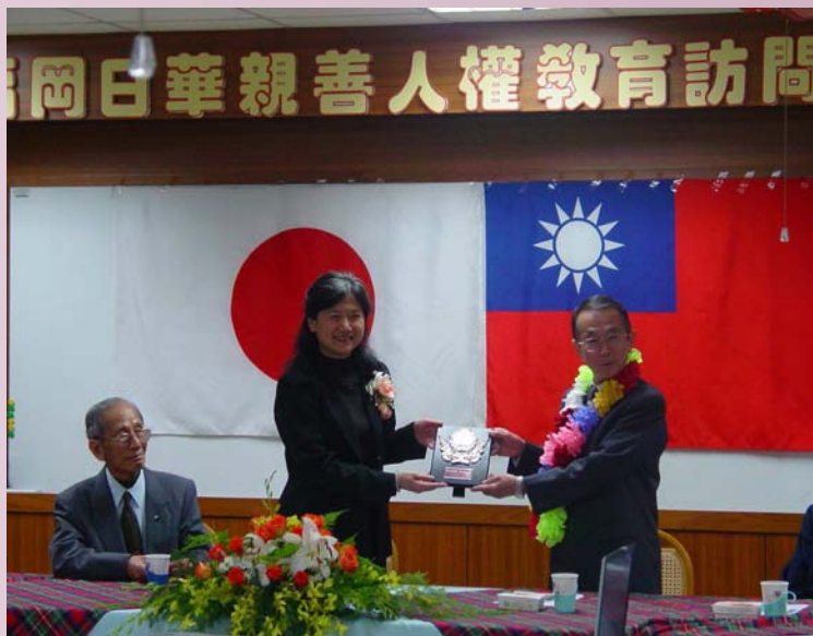
民國 91 年福岡日華親善人權教育訪問團蒞校交流