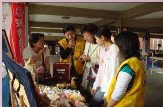
協助瑞復益智中心園遊會義賣