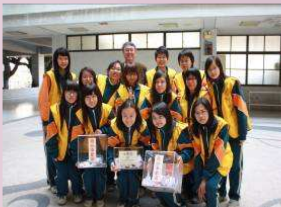
97 學年度募集發票協助創世基金會