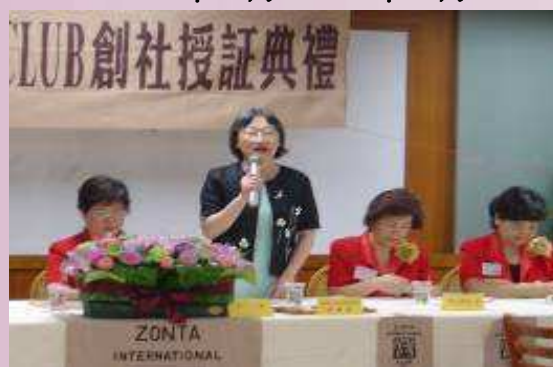
台南鳳凰 Z CLUB 創社授證典禮. 郭校長暨國際崇她社台南社社長致詞