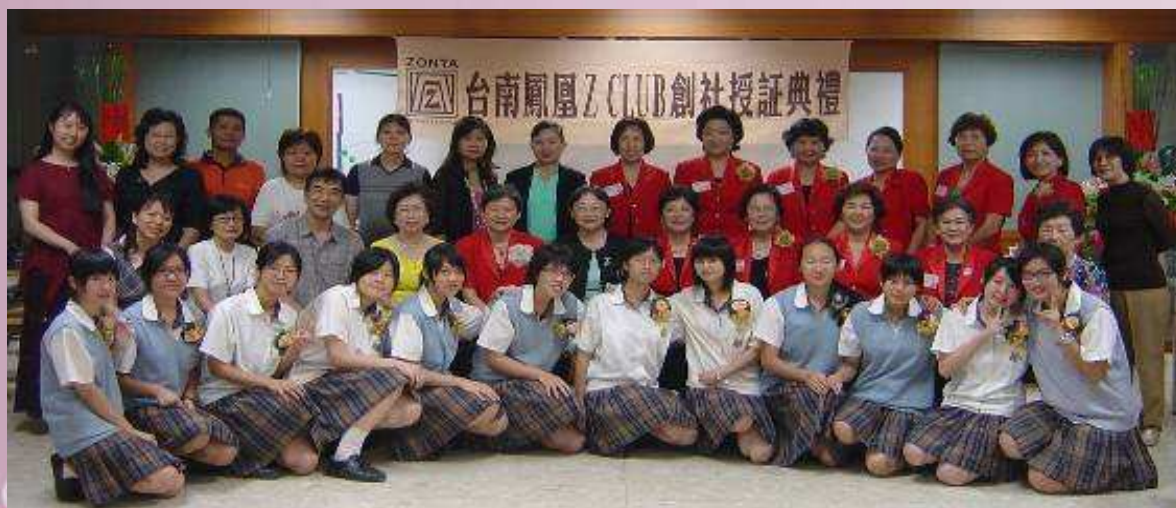
本校第一屆小崇她社 (z-club) 與國際崇她社台南社暨師長於創社授證典禮合影