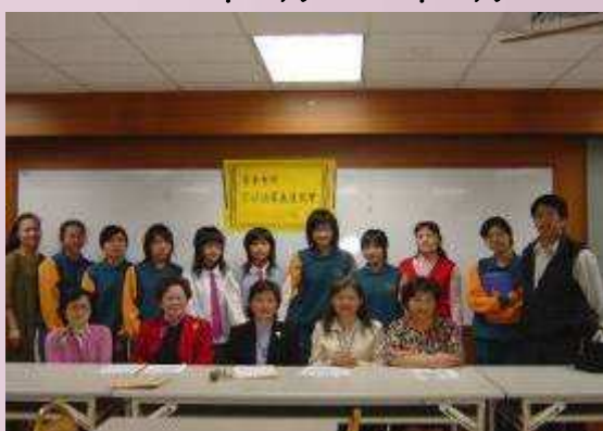
本校小崇她社家長座談會