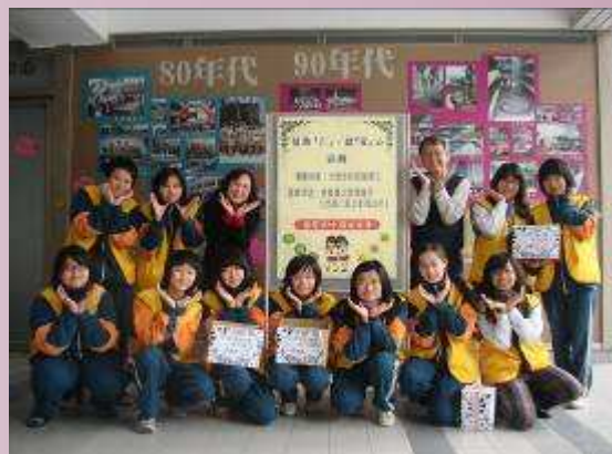
98 學年度響應仁愛活動募集發票