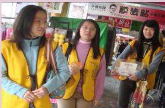
校外募集發票協助創世基金會