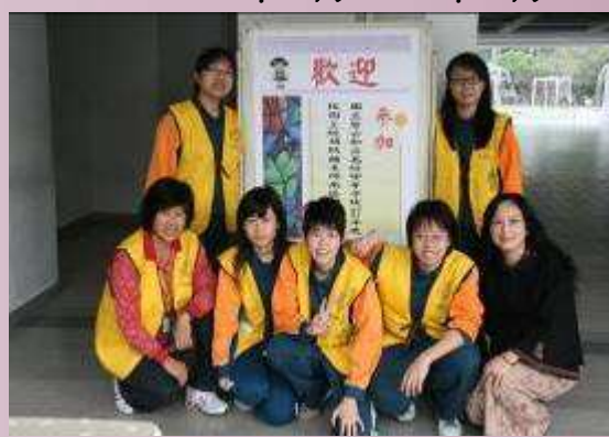
志工服務--校園三級預防南區研討會