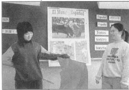
↑光華女中西班牙語社以輕鬆活潑方式，介紹西語系國家文化，學子們揮舞著鬥牛旗，深覺有趣。