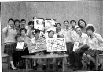
光華女中邀請府城耆老與學子對話，除分享以往過中秋的特有習俗外，並讓年輕學子深入了解府城在地文化。(記者林雪娟攝)